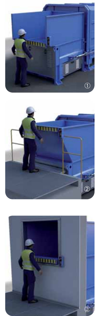
① Befüllung vom Boden ② Befüllung von einer Laderampe ③ Befüllung durch eine Gebäudewand